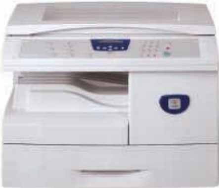
WorkCentre M15/şaryodan çekim özelliği ile