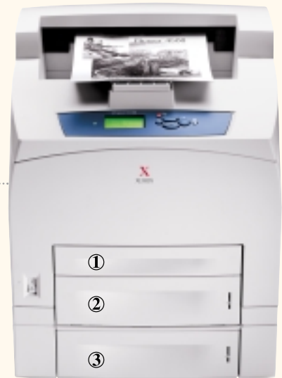
Phaser 4500DT yazıcı

İsteğe bağlı iki taraflı (duplex) baskı otomatik ve hızlıdır.